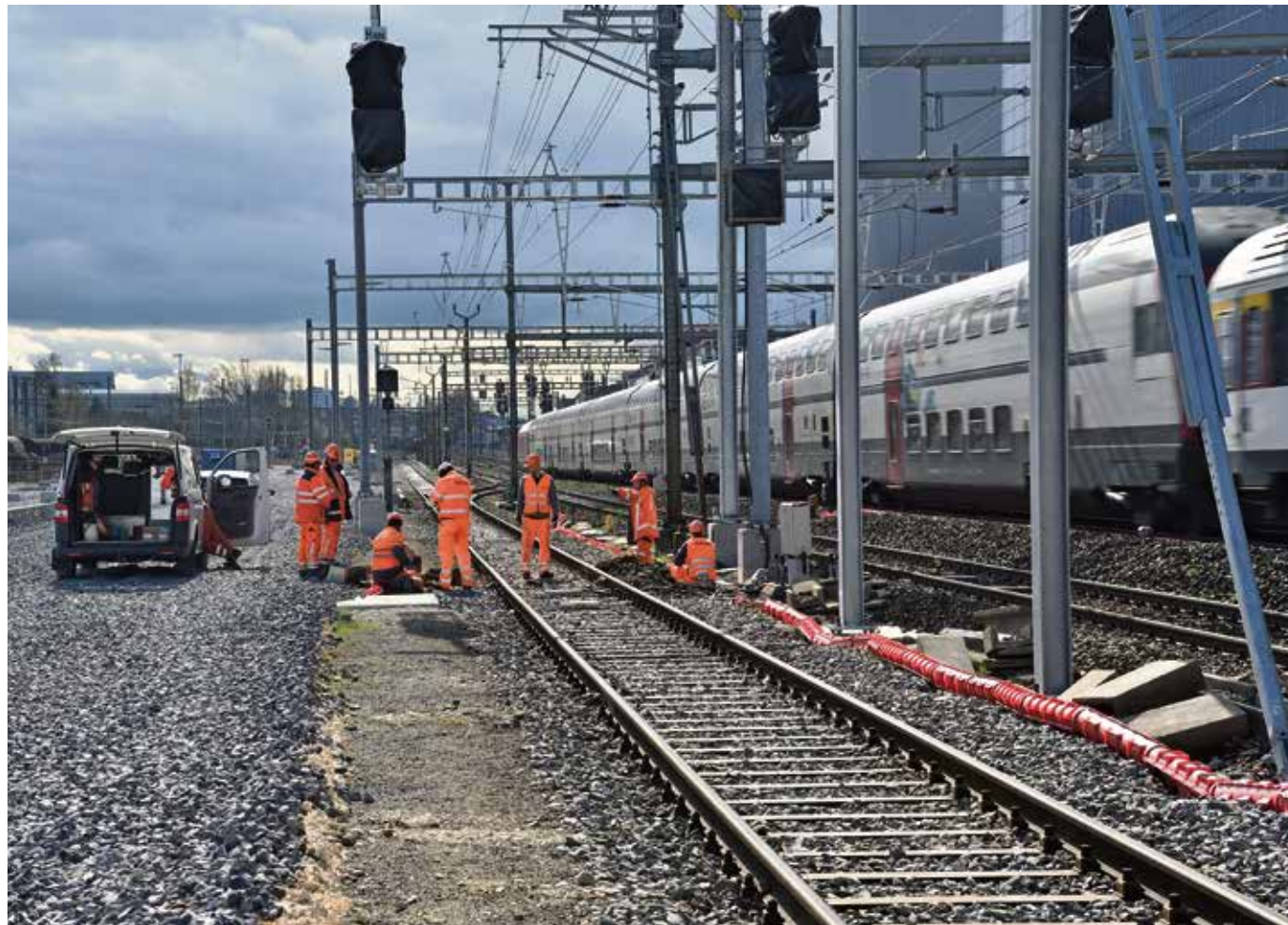
Les multiples chantiers sur la ligne ferroviaire de l'Arc lémanique ont pour but de révolutionner la mobilité d'ici à quelques années.